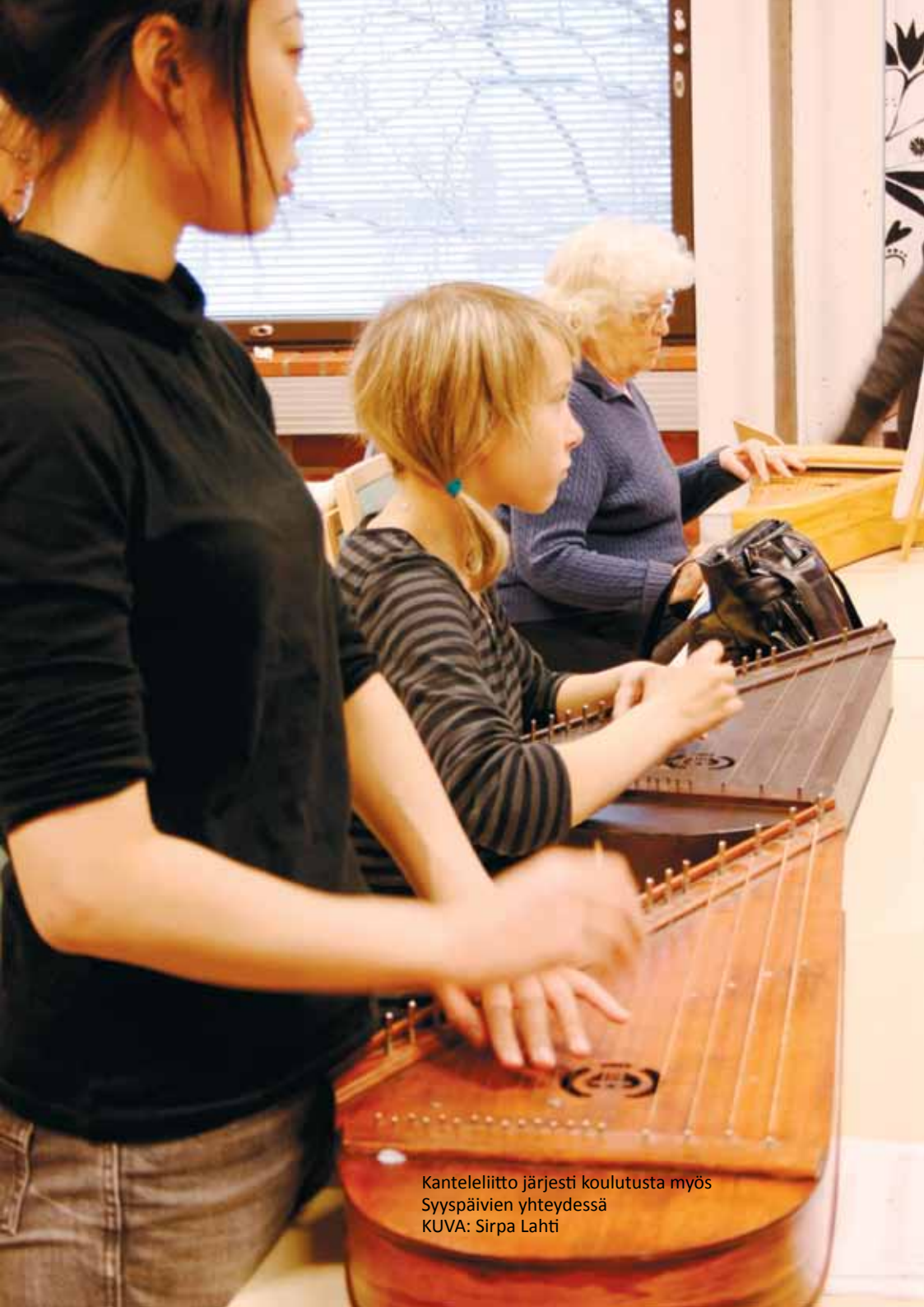
Kanteleliitto järjesti koulutusta myös Syyspäivien yhteydessä