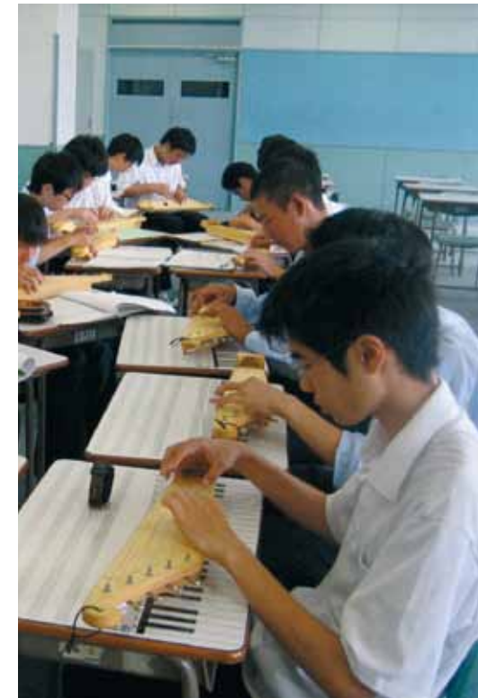
Japanissa on paljon innokkaita kanteleensoiton harrastajia. Kuva Sapporosta Kuva: Yuji Itakura

Edellä mainitun toiminnan lisäksi Kanteleliiton toimistolla on vierailut lukemattomia kansainvälisiä vieraita, joille on annettu kanteleeseen liittyvää materiaalia.